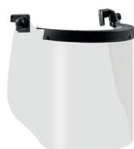
WV100014 ARC VISOR CLASS 1