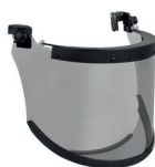
WV100034 ARC VISOR CLASS 2 ERGO