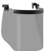
WVI00016 ÉCRAN ARC VISOR ATPV10