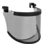
WVI00035 ÉCRAN ARC VISOR ATPV27 ERGO