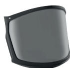
WVI00008-510 ZEN VISOR SMOKE