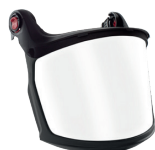
WKI00003-500 KIT ZEN FF VISOR CLEAR