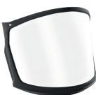
WVI00008-500 ZEN FF VISOR CLEAR