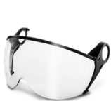
WV100007 ZEN VISIER