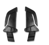
WAC00011 4 STK LEUCHTCLIPS