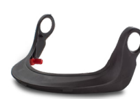
WAC00010 NETZVISIERE CARRIER