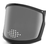
WV100008 ECRAN ZEN