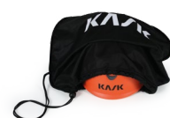
UAC00002 SAC PORTE CASQUE