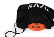
UAC00002 SAC PORTE CASQUE