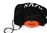
UAC00002 BOLSA PORTACASCO