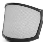
WV10009/10 PANTALLA RETE ZEN