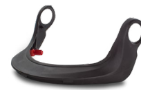
WAC00010 SOPORTE PANTALLA